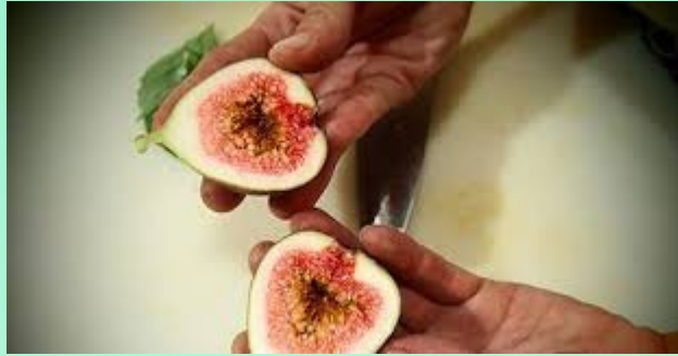
תריפס הקיקיון , תריפס הטבק