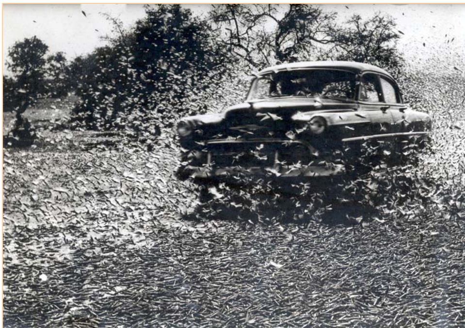
תמונות משנות ה-50 באזור הנגב