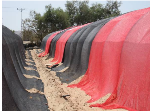
תמונה 1: מראה כללי של מנהרת הניסוי, חוץ (ימין) ופנים