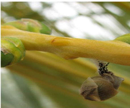
נזק של עש התמר הקטן