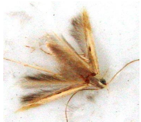
זכר בוגר של עש התמר הקטן

עש התמר הקטן (בטרחדרה) הינו מזיק ייחודי לתמר, התוקף וניזון אך ורק מפרי תמר שאינו בשל. זחל העש עובר את החורף בתרדמה, באביב שב לפעילות וניזון על התפרחות הראשונות, מתגלם והופך לעש בוגר. בחודש מרץ מתחיל להופיע דור חדש, עד יולי מקים העש שלושה - ארבעה דורות. לאחר מכן נפסקת פעילותו עד לאביב הבא. משך דור (מביצה לביצה) כחודש ימים. הזחל חי כשבועיים, ובמהלכם פוגע בתפרחות ובפרי ועלול לגרום לנזק כלכלי חמור, עד כדי אובדן של 75% מהיבול. הנזק נגרם בחדירה לפרי באזור עלי הגביע ומתבטא בהפרשת גללים וקורים. פרי שניזוק נושר ונותר תלוי על הסננים.