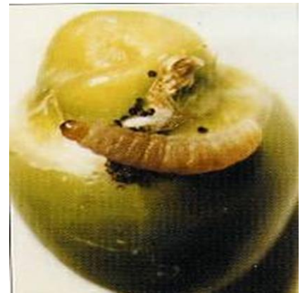
זחל של המזיק